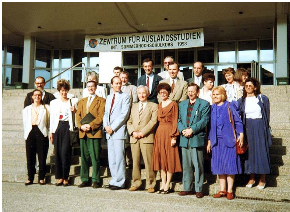
Die Teilnehmer/innen am zweiten Sommerkurs für Hochschullehrer aus den Reformländern im Juli 1993