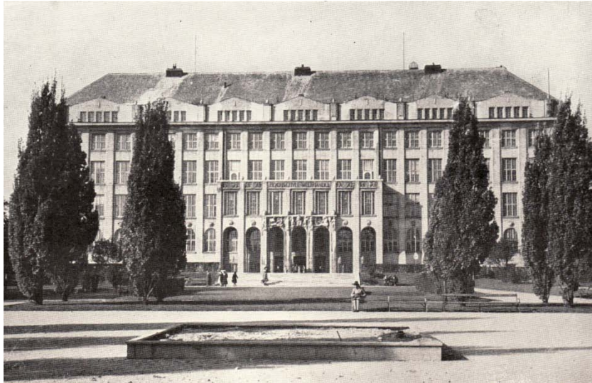
Das Gebäude der Hochschule für Welthandel aus 1916 (Aufnahme vermutlich aus 1948)